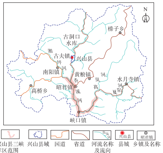
图 1 兴山县三峡库区地理位置图

兴山县位于鄂西褶皱山系, 境内山高坡陡, 海拔相对高差 2 317 m, 山体平均坡度 25°以上, 岩体断裂、节理切割破碎严重, 地质条件较为复杂。区域内水系发育, 地形陡峻, 降雨量相对集中, 加之近年来受三峡水库不定期蓄退水的影响及各种人类工程活动影响, 受双重压力多种因素的影响, 地质灾害频发。如 2007 年 5 月 31 日, 高阳至古夫二级电站 200+147 km 处发生滑坡, 导致交通中断; 2008 年 4